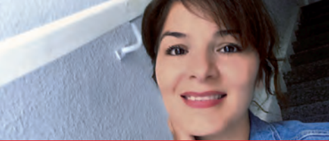
هوليا مليك وكالة تمثيل أولياء الأمور في مدرسة Molkenbuhstraße