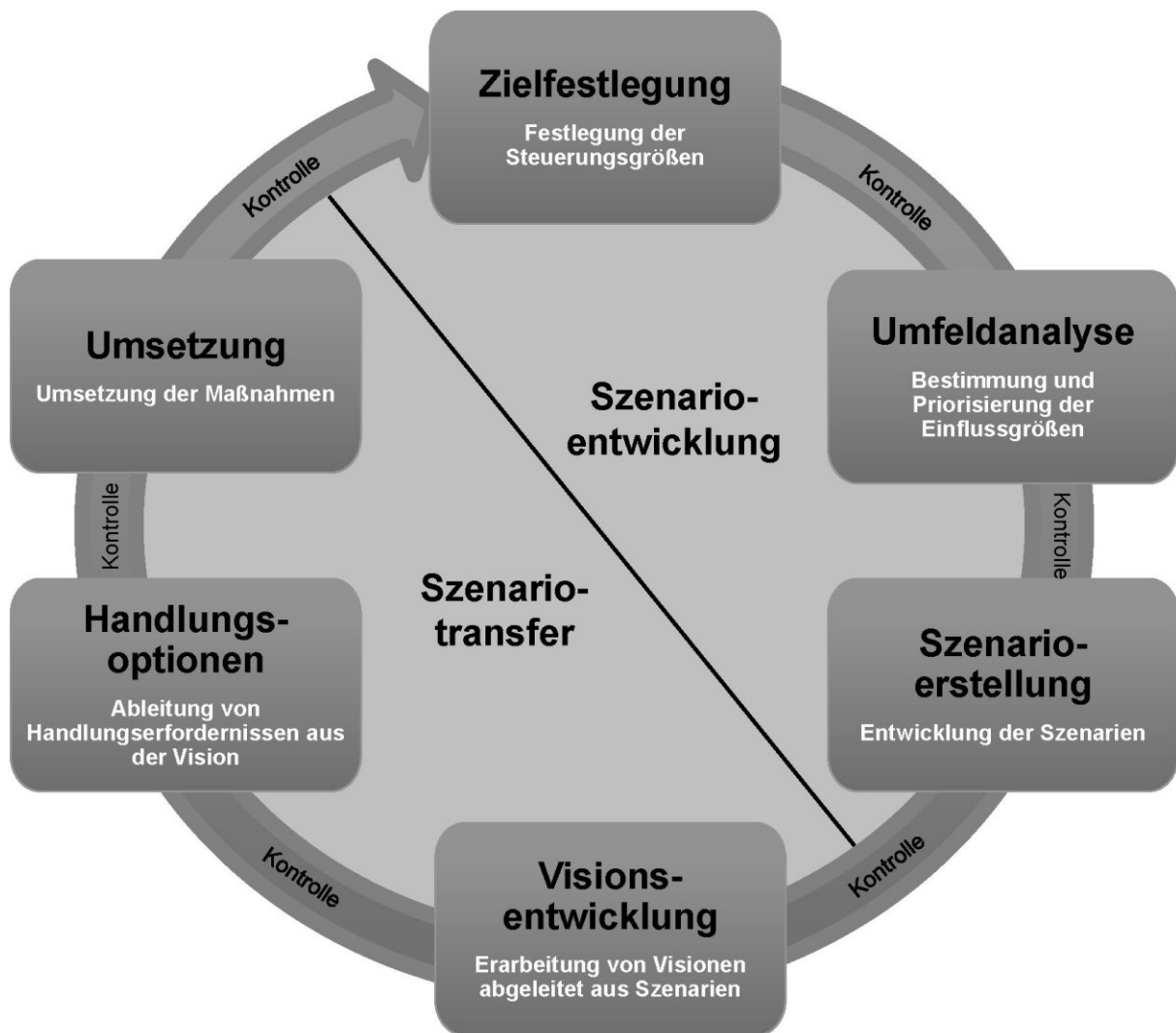
Abbildung 1: Die Methode Szenarioanalyse 26