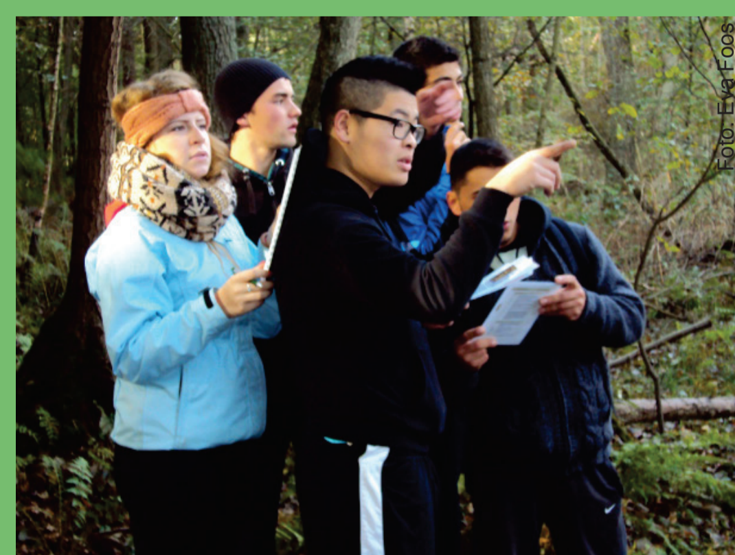
Berliner Zwölfklässler im Forschungscamp „Wald und Klimawandel“ .