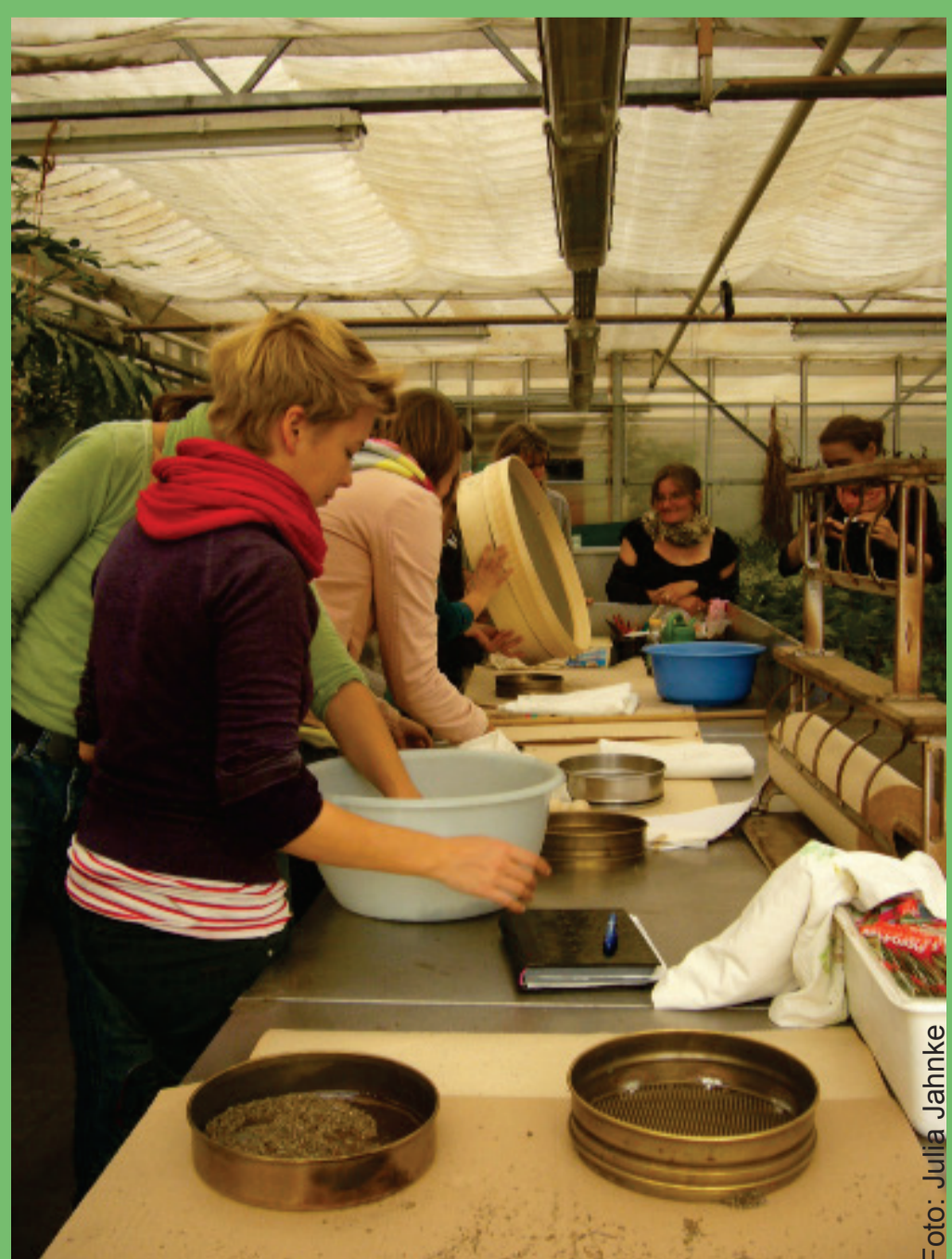
MultiplikatorInnen der AG KlimaBildungsGärten in einem Workshop.