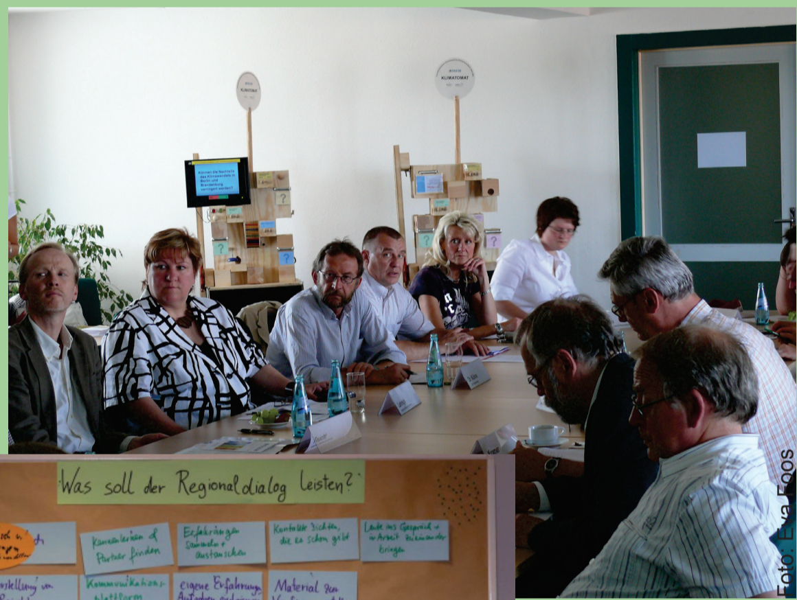
WissenschaftlerInnen und Multiplikatoren aus Bildung, Verwaltung und Politik im Regionaldialog Lausitz-Spreewald .