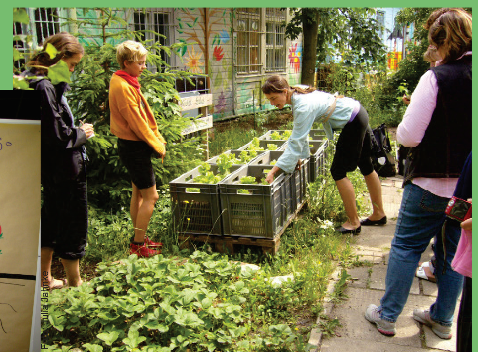
Klimagarten und Projekttag zu Klimawandelanpassung in einem Kinder- und Jugendklub.