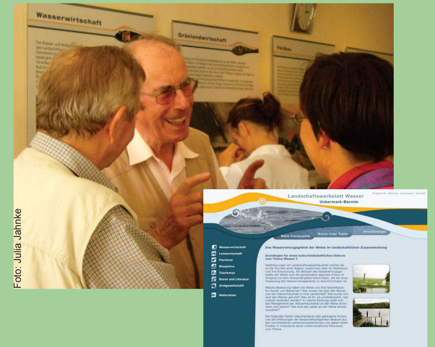
Die Landschaftswerkstatt Wasser Uckermark-Barnim : Begleitung des Diskurses zum Umgang mit Wasser durch Gespräche, Ausstellung und Webseite.