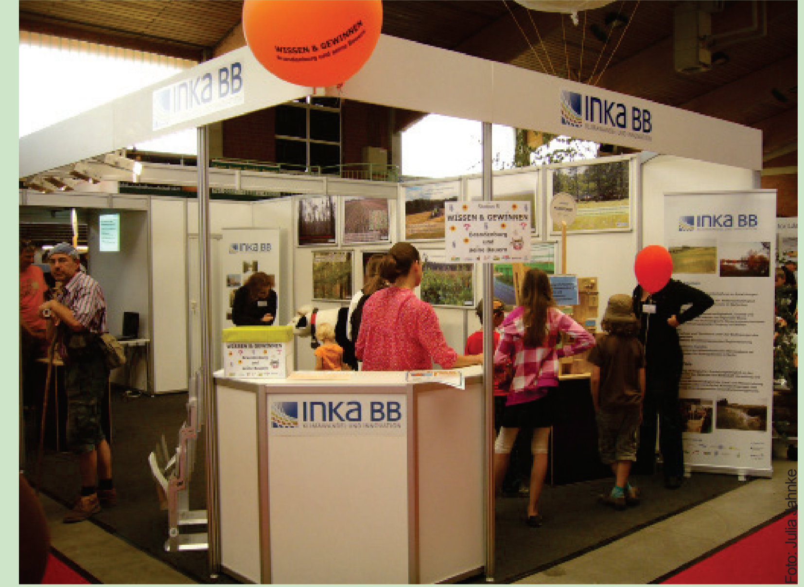
Messepräsentationen, hier auf der Brandenburgischen Landwirtschaftsausstellung.