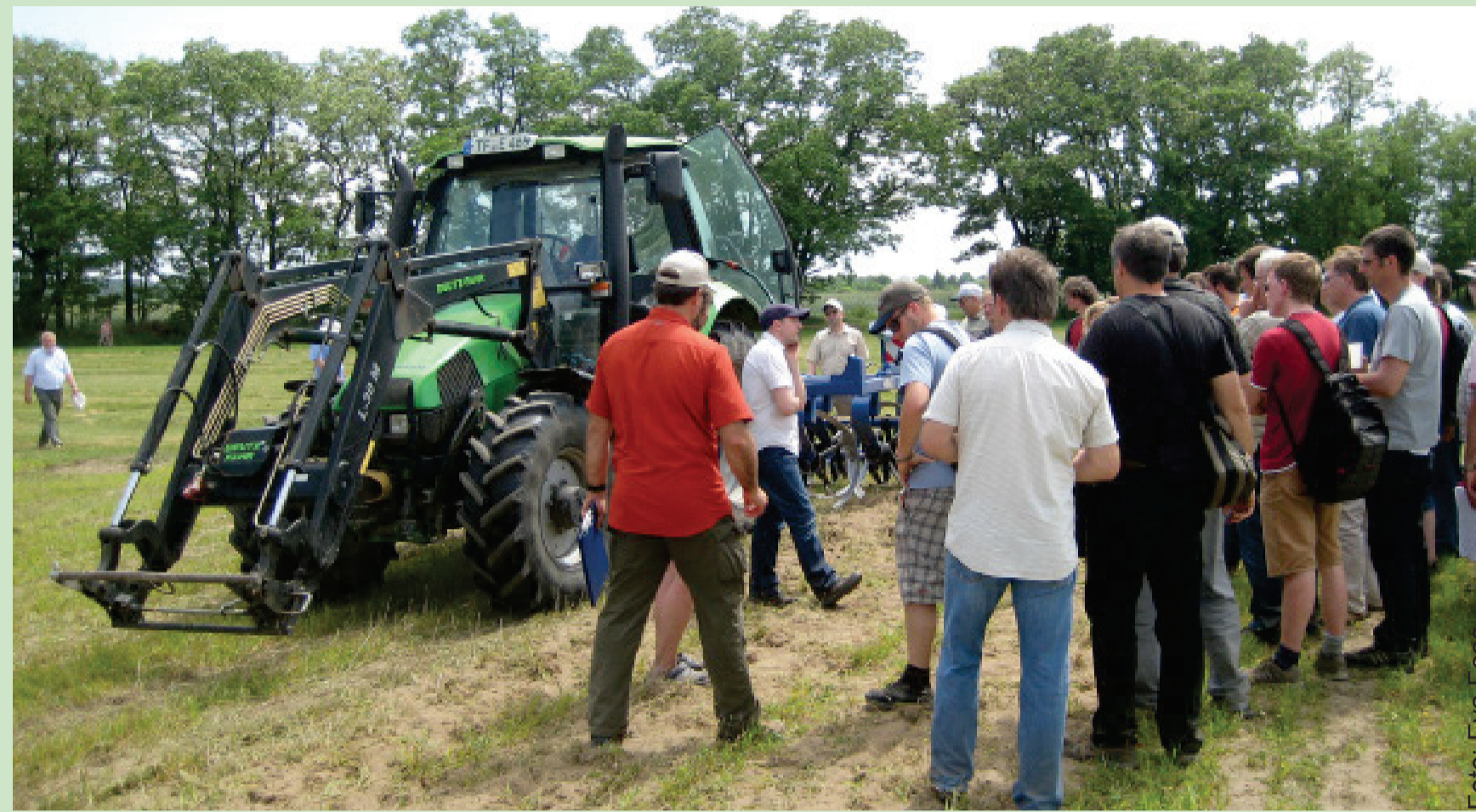
Feldtage in Thyrow zu Anpassungsstrategien bei der Bodenbearbeitung und Sortenwahl.