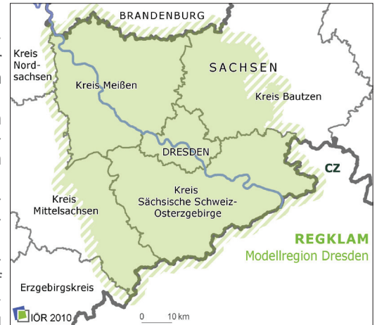
(Abbildung 1) REGKLAM-Modellregion Dresden

Daher ist es unerlässlich für die Unternehmen der Modellregion Dresden, Anpassungsmaßnahmen bzgl. der Einflüsse des Klimawandels auf das Personalmanagement vorzunehmen und so neben der Sicherstellung der Arbeitsbedingungen auch die Motivation der Mitarbeiter zu erhöhen.