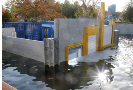
Starkregen-Schott im Test

Doch Privatleute und Unternehmen können nun ihre Gebäude vor derartigen Überraschungen durch Starkregen oder Überschwemmungen schützen. Das in Neuwied am Rhein ansässige Unternehmen AQUA-STOP Hochwasserschutz GmbH hat im Rahmen von KLIMZUG-NORD Teile seiner angebotenen Hochwasserschutzsysteme zu intelligenten, automatischen Systemen weiterentwickelt. Ein sogenanntes Starkregen-(SR)-Schott