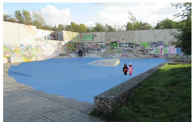
Skaterfläche als innerstädtischer Rückhalterraum

lumen von rd. 750 m 3 zwischengespeichert werden und damit eine Überflutung des Straßenraums verhindern. m.siekmann@fiw.rwth-aachen.de