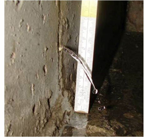
Wassereintritt in Tiefgarage nach Grundwasseranstieg durch Starkregen

Auf dieser Grundlage werden für die wichtigsten Einwirkungen Analyseverfahren entwickelt, mit denen die Verletzlichkeit des baukonstruktiven Gefüges besser beurteilt werden kann. Im Ergebnis der REGKLAM-Forschungsarbeit wird ein Katalog mit bau- und haustechnischen Anpassungsmaßnahmen zur Verfügung gestellt. t.naumann@ioer.de