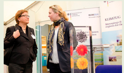
KLIMZUG auf dem IW-Gremientag

Ein zentrales Anliegen des KLIMZUG-Begleitprozesses im Institut der deutschen Wirtschaft Köln (IW Köln) besteht darin, die Ergebnisse aus den Verbundprojekten sowie der KLIMZUG-Begleitforschung zur Anpassung in Unternehmen und Kommunen in der Öffentlichkeit zu präsentieren. Dabei kommt den Akteuren aus der Wirtschaft eine besondere Bedeutung zu. Um dieser Rolle gerecht zu werden, nutzt das Team im Begleitvorhaben außer externen Veranstaltungen, Vorträgen und Publikationen auch IW-Veranstaltungen, an denen überwiegend Vertreter aus Unternehmen und Wirtschaftsverbänden teilnehmen. Basierend auf den IW-Untersuchungen konnte das Thema Anpassung beispielsweise bei dem „Wirtschaftspolitischen Treffen“ mit Volkswirten aus den wesentlichen Verbänden der Privatwirtschaft diskutiert werden. Außerdem war das Team am diesjährigen „IW-Gremientag“ mit einem Bücherstand und einer Poster-Präsentation aktiv beteiligt. Im Gespräch mit Vertretern aus Unternehmen und Wirtschaftsverbänden konnte auf die KLIMZUG-Ergebnisse näher eingegangen und mit den Teilnehmern diskutiert werden.