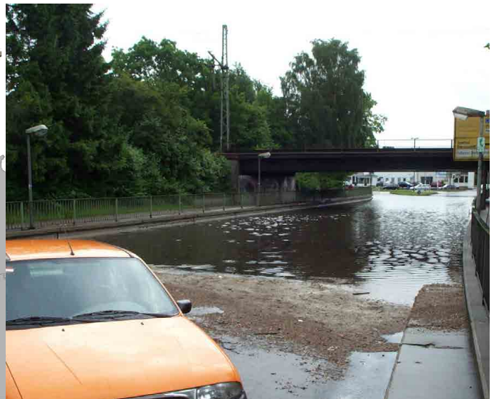
Abb. E.1.2: Straßenzug in Elmshorn nach einem Starkregenereignis